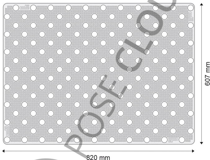
Vue de dessus (éch. : 1/10) :